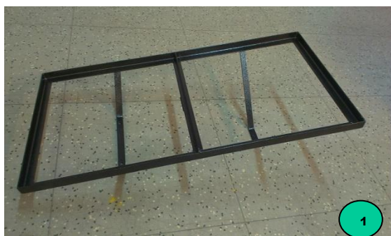
Obr. 1: Nástavba pro včelaře – dodávaný komplet

Odšroubujeme korbu z rámu Motúčka a přiložíme nástavbu pro včelaře na rám Motúčka