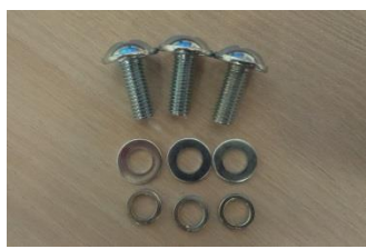
Šrouby pro připevnění nástavby na rám Motúčka