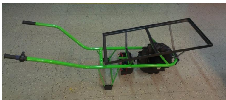
Obr. Č. 4: Nástavba pro včelaře – celý komplet

Přepravky se vsadí do konstrukce a při transportu nehrozí jejich sklouznutí z nástavby Motúčka.