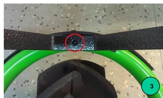
Obr. 3: Otvor na připevnění nástavby pro včelaře na rám Motúčka v přední části rámu u pojezdového kola.